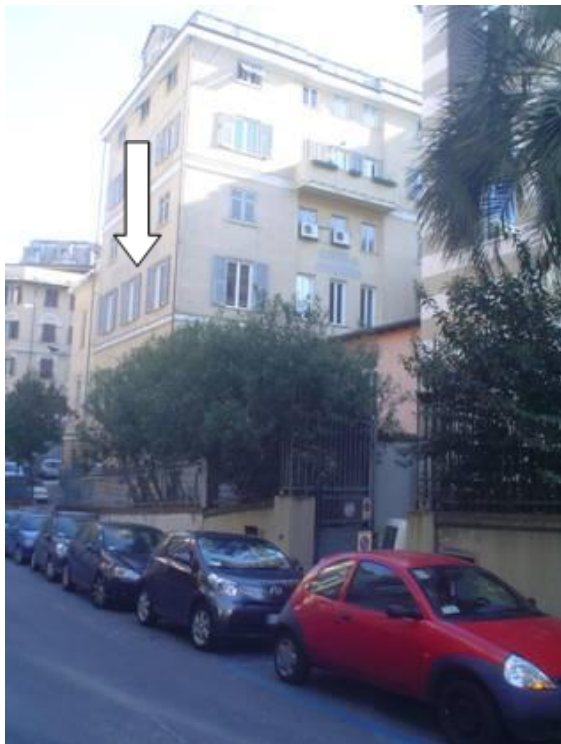
Vue d'en bas (Via Felice Romana). La flèche désigne l'espace no 5 sur le plan (atelier). Entrée côté cour.

Les deux ateliers de la CVC, situés à peine à dix minutes de la gare Brignole et de la zone commerciale (centre-ville), se trouvent dans le bâtiment de l'Unione elvetica (1890). Deux ateliers, ainsi que deux habitations d'env. 20m 2 , une cuisinette (2 plaques électriques) et une petite salle de bain (douche et lavabo) ont été installés au 1 er étage. Les ateliers sont spacieux et lumineux. Dans le plus petit, il y a un évier et il sera de ce fait plutôt destiné aux arts visuels.