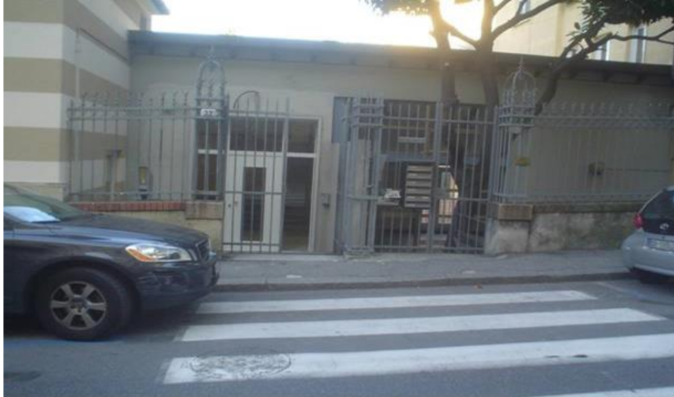
Entrée de l'immeuble Via Peschiera 33.