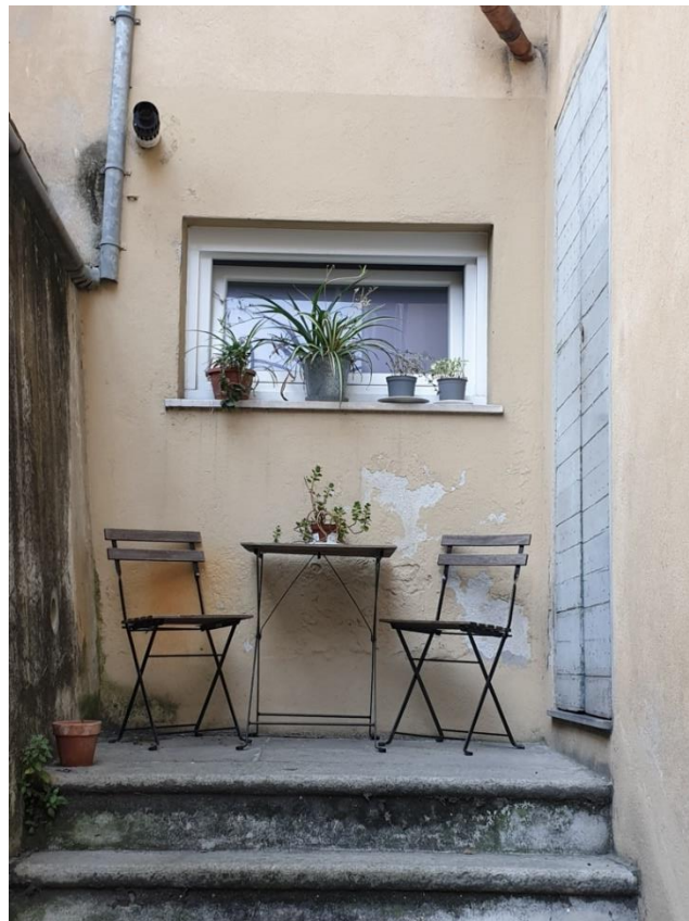
Seconde entrée depuis la Cour.