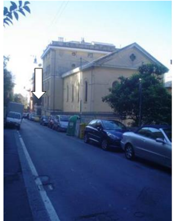
Vue de dessus, prise en amont de l'Unione elvetica. La flèche montre l'entrée. A l'avant-plan, on voit l'église au-dessus des locaux 1, 2, 3 et 4.